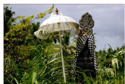
Altar im Reisfeld

4. Nov: Transfer zum Flughafen, Rückflug