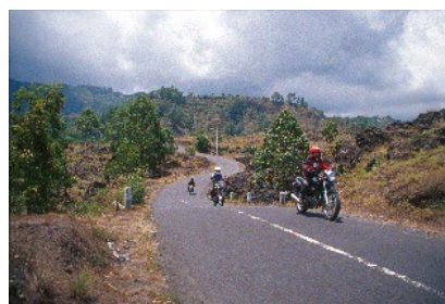
Strasse in den Bergen