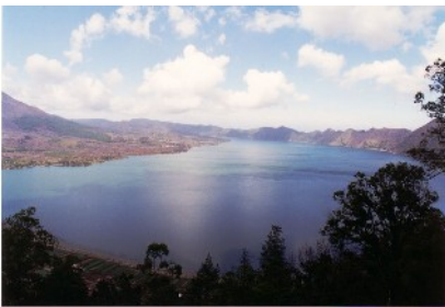
Kratersee am Gunung Batur

26. Okt: Weiterfahrt nach Kintamani zum Vulkan Gunung Batur, Rundfahrt durch den Krater, anschließend geht es steil bergab Richtung Küste nach Amed. Übernachtung im Hotel