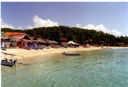
Bucht von Padangbai

18. Okt: Fahrt durch die Berge nach Sidemen und Klungkung, Besichtigung der Gerichtshalle Kerta Gosah, Weiterfahrt zum schwarzen Strand von Pura Klotok, zum Abschluß Badeaufenthalt an der Whitesand-Beach in Padangbai