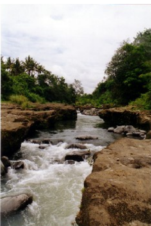
bei Sampalan Kelod

20. Okt: Fahrt zum Fuß des zweithöchsten Vulkans, dem Batukaru. Bei schlechtem Wetter: Besuch des Affenwaldes, Fahrt durch die Reisterrassen nach Petulu und zu den Holzschnitzern von Tegallalang. Abends Möglichkeit zum Besuch einer traditionellen Tanzveranstaltung (optional*)