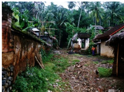
Bali Aga Dorf