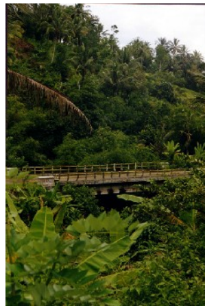
Strasse bei Ubud