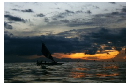
Sonnenaufgang auf dem Meer

27. Okt: Weiterfahrt auf der spektakulären Küstenstrasse rund um den Vulkan Gunung Seraya nach Padangbai, Rückgabe und Überprüfung der Motorräder